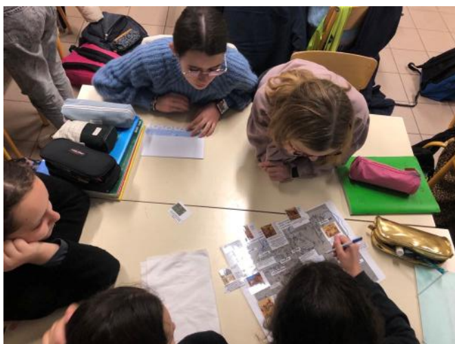
1/ Etude de la Seigneurie de Châteauceaux à partir d'un croquis de la citadelle datant du milieu du XV ème siècle. Début janvier 2025.

Enseignante en histoire-géographie au Collège St Benoît d'Orée d'Anjou