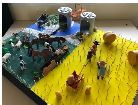
4/ Maquette sur « Le travail des paysans à Châteauceaux au Moyen Age »